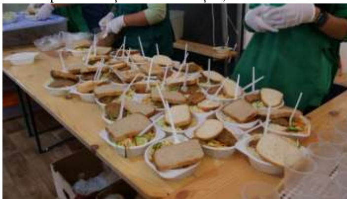
porții de mâncare - Cernăuți

Gândește-te că Cernăuțiul are vreo 250.000 de locuitori. Veniseră 100.000 de refugiați, doar înregistrați oficial acolo. Se dormea în săli de clasă, peste tot unde se putea. Și părintele Vasile și-a pus